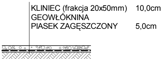
PRZEKRÓJ PRZESZCZNIĘ 1:50