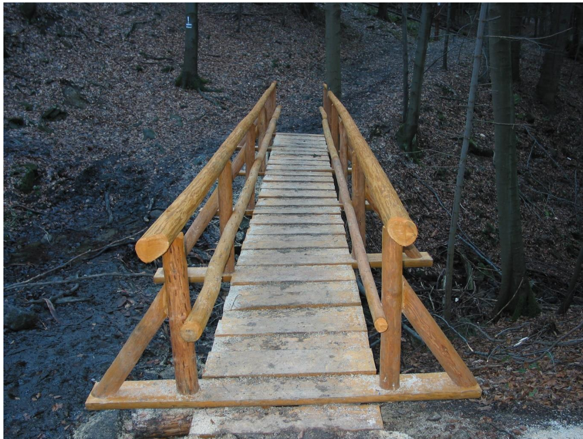
Kładka – 10 m.